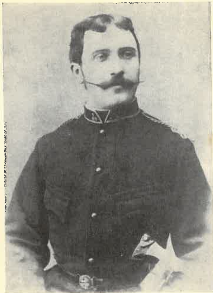
Guzmics Gusztáv főparancsnok (1897)