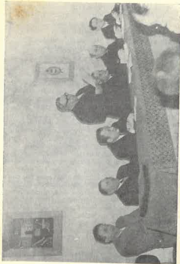
A kapuvári és gartai Önkéntes Tűzoltó Egyesület egyesítő közgyűlésének elnöksége (1972. január 30.)

„A közgyűlés egyhangúlag, ellenszavazat nélkül elfogadta a Gartai és Kapuvári Önkéntes Tűzoltótestület egyesülését. Ezután egyhangúlag, ellenszavazat nélkül