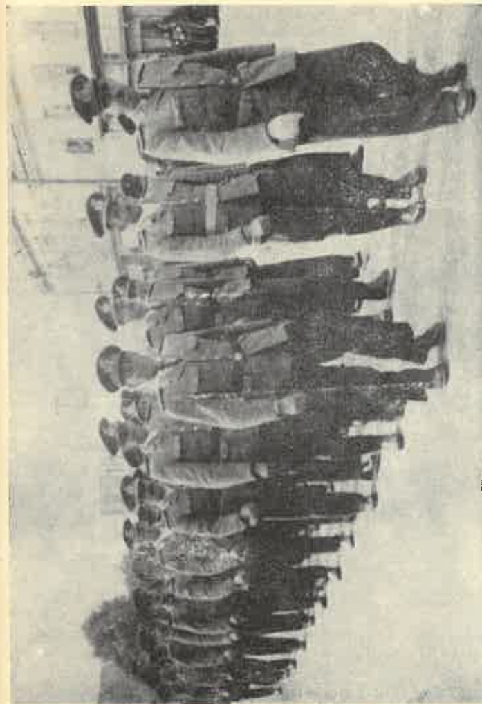
Önkéntes tűzoltók a május 1-i felvonuláson (1950)

53. Működési Napló; 1947. január 3. SAL.