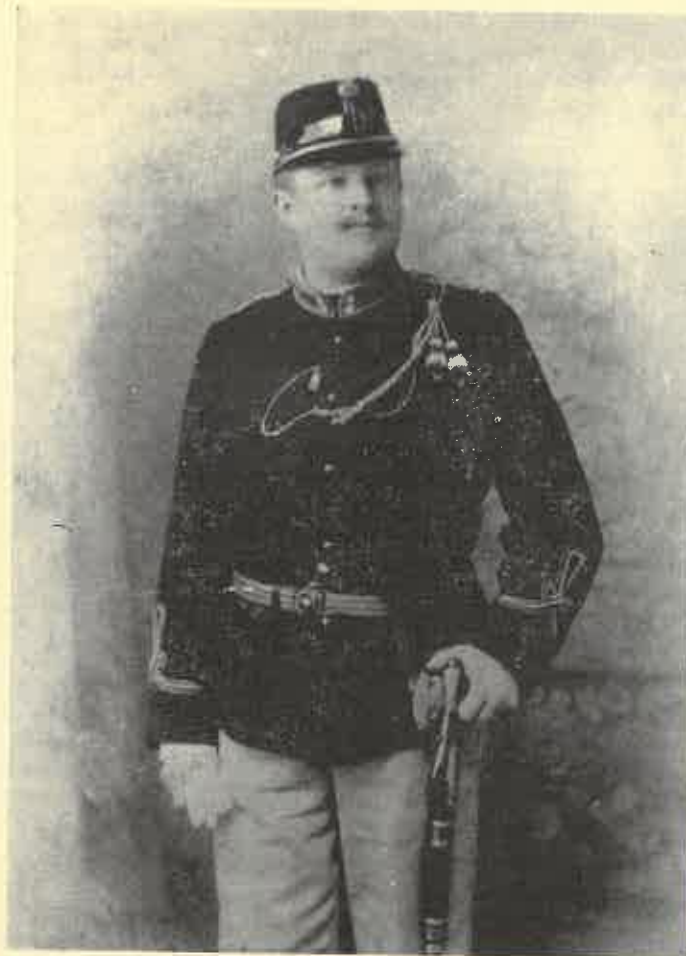
Krón Ágoston főparancsnok (1913)