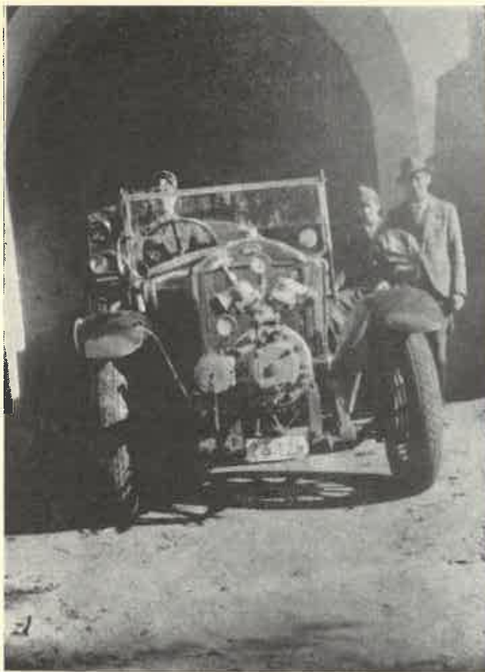
Levente-tűzoltók készenléti szolgálata légiriadó alatt (1943)