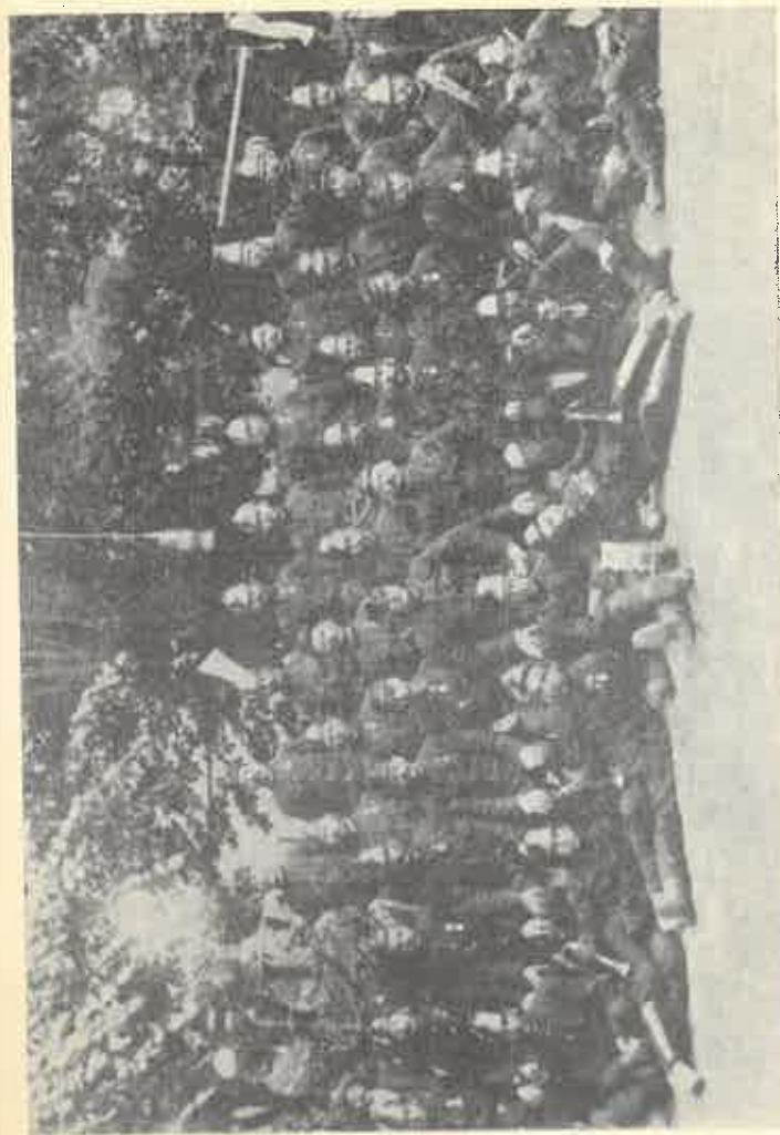
A Kapuvári Önkéntes Tűzoltó Egyesület (1912)